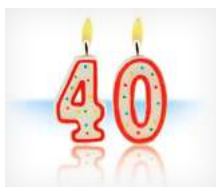
Persone sopra i 40 anni

È importante in queste situazioni prestare maggiore attenzione alla cura delle gengive, perchè le gengive sane rappresentano le fondamenta dei denti sani.