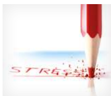
Persone soggette a stress