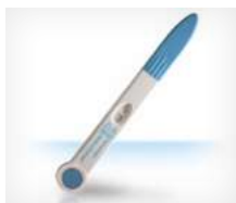
Donne in gravidanza

Pertanto, alcune persone potrebbero essere maggiormente predisposte all'infiammazione gengivale: